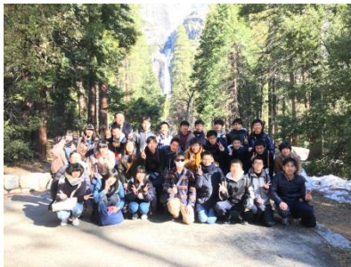
～平成30年度SSH海外研修～ (ヨセミテ国立公園)

本校は平成16年度から第1期(3年)、平成19年度から第2期(5年)、平成24年度から第3期(5年)、平成29年度から第4期(5年)のスーパーサイエンスハイスクール(SSH)として文部科学省からの指定を受け、理数系教育の地域拠点校としての役割を期待