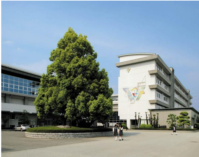
5階建ての校舎、2階建ての体育館など充実した学習環境

所在地 〒400-0854 甲府市中小河原町 222 番地 電話 055-241-3191 FAX 055-241-3145 URL https://www.kofuminami-h.ed.jp E-mail nanko@kofuminami-h.ed.jp 創立 昭和38年4月1日 課程 全日制 利用交通機関 JR身延線 甲斐住吉駅より徒歩12分 山梨交通バス 甲府南高校前(学校入口) 教員数 53名 生徒数 797名