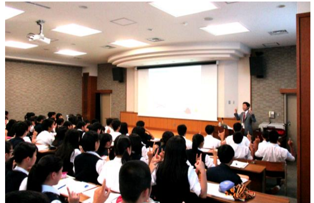
産業社会と人間 「頭の回転がUPする一速読技術」講座

生徒一人ひとりの個性を伸ばすことを基本に、将来の職業選択を視野に入れた科目選択の指導を行います。「産業社会と人間」「総合的な探究の時間」などの授業を通じてあなたの輝く未来が見えてくるはずです。