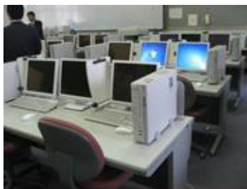
充実した設備のパソコン室

校訓に「質実剛健」「不撓不屈」「士魂商才」を掲げ、「主体的な学びによる学力向上」と「社会で活躍できる人づくり」を教育の柱としています。文武両道を目標に学習と部活動を大切に、これからの社会を力強く生き抜いていく力を育成します。