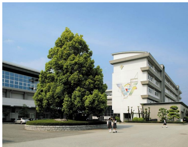
5階建ての校舎、2階建ての体育館など充実した学習環境

所在地 〒400-0854 甲府市中小河原町 222 番地 電話 055-241-3191 FAX 055-241-3145 URL https://www.kofuminami-h.ed.jp E-mail nanko@kofuminami-h.ed.jp 創立 昭和38年4月1日 課程 全日制 利用交通機関 JR身延線 甲斐住吉駅より徒歩12分 山梨交通バス 甲府南高校前(学校入口) 教員数 53名 生徒数 750名