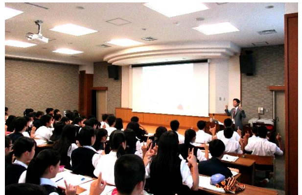
産業社会と人間 「頭の回転がUPする一速読技術」講座

生徒一人ひとりの個性を伸ばすことを基本に、将来の職業選択を視野に入れた科目選択の指導を行います。「産業社会と人間」「総合的な探究の時間」などの授業を通じてあなたの輝く未来が見えてくるはずです。