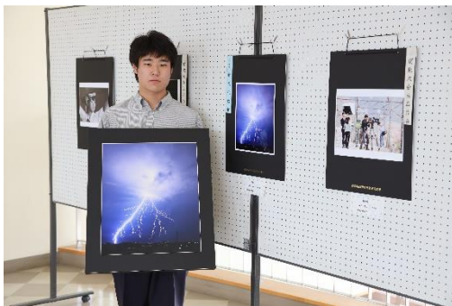
芸術文化祭賞を受賞した写真部員

本校では、甘利山強歩大会、球技大会、学園祭等、本校独自の楽しい学校行事・生徒会行事を多数取り入れています。また、部活動を通じて「心身」を鍛え、充実した高校生活をおくるため、全員入部制を実施しています。部活動は、オリンピック金メダリストを輩出し、全国優勝者を出したレスリング部をはじめ、サッカー部、バレーボール部、野球部、ソフトテニス部、バスケットボール部、陸上部、卓球部、テニス部、ハンドボール部、弓道部、剣道部、山岳・スキー部、バドミントン部、茶道部、太鼓部、写真部、吹奏楽部、エコカー部、ロボット工学部、囲碁・将棋部、資格取得部、環境化学部、文化・生活部等多くの部が活躍しています。