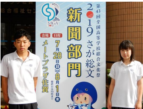
3年連続全国総文祭出場（新聞委員会）