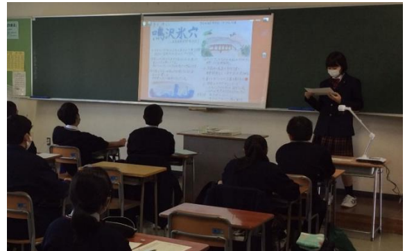
総合的な探究の時間（J-SPACE）の様子

生徒一人ひとりの個性を伸ばすことを基本に、将来の職業選択を視野に入れた科目選択の指導を行います。「産業社会と人間」「総合的な探究の時間」などの授業を通じてあなたの輝く未来が見えてくるはずです。