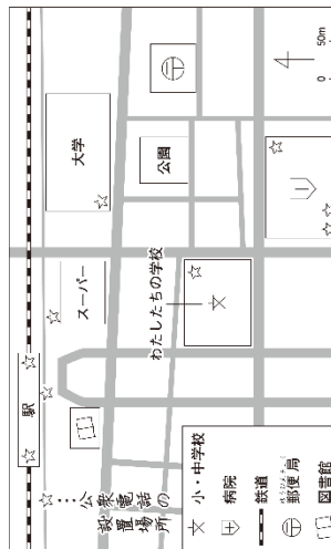
〈資料3〉 公衆電話の設置場所を示した地図