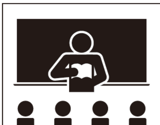
【 A 】