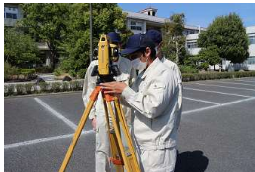
トラバース測量実習

農業と環境・農業と情報・総合実習・課題研究・環境土木計画・測量・農業土木設計・農業土木施工・インターンシップ・水循環・応用測量・水文水利・材料施工