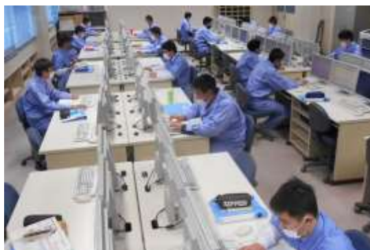
コンピュータ実習