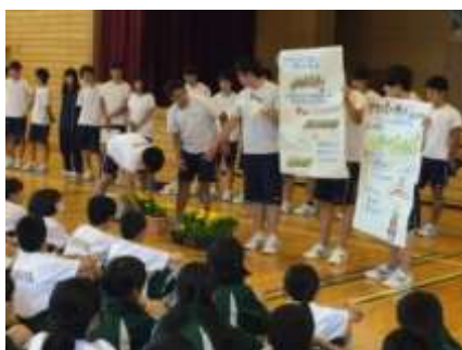
異校種間連携授業(笛吹市一宮中学校)