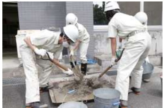
コンクリート実習