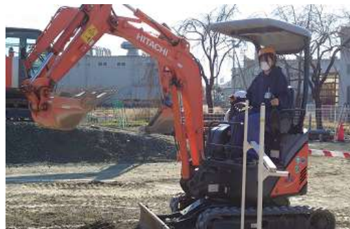
資格取得（小型車両系建設機械・3t未満）

農業と環境・総合実習・造園計画・測量・造園植栽・課題研究・農業と情報・樹木治療学・インターンシップ・ガーデニング基礎・造園施工管理・剪定技術