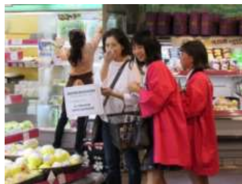
シャインマスカット台湾輸出版売実習(台北)

農業と環境・農業と情報・課題研究・地域資源活用・果樹・野菜・草花・植物バイオテクノロジー・生物活用・農業経営