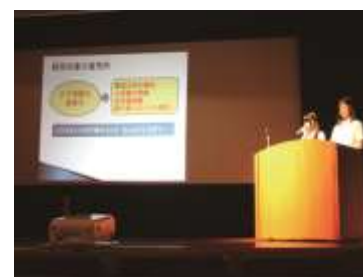
生徒商業研究発表大会