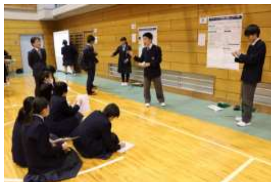
ポスターを使ったプレゼンテーション