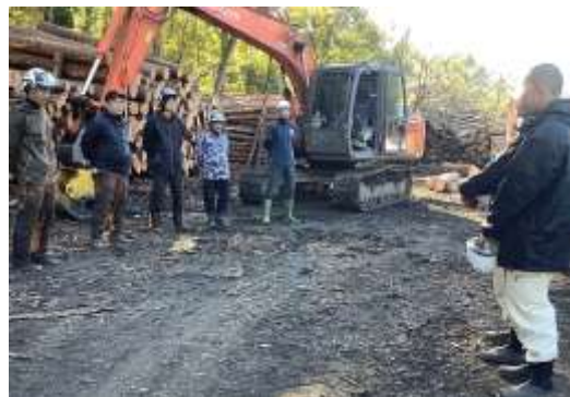
高性能林業機械研修

農業と環境・総合実習・測量・森林科学・ウッドイークラフト・森林経営・課題研究・農業と情報・森林土木・インターンシップ・林産物利用