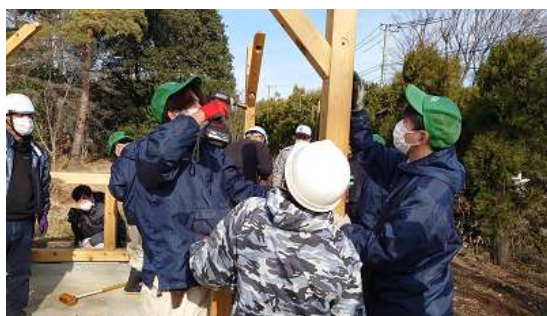
課題研究 四阿の制作プロジェクト

専門科目の学習は、実験・実習を中心として、基礎的、基本的な事項を体験的・体系的に学びます。