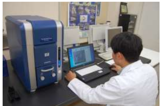
走査電子顕微鏡実習