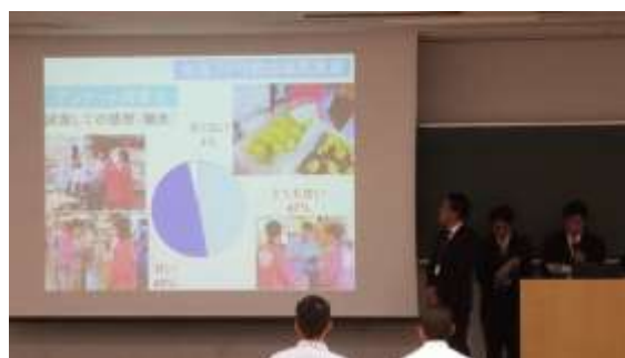
GAP シンポジウムでの発表(東京農業大学)