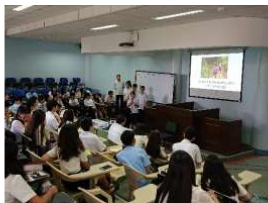
研修旅行での交流風景

探究科では、週に2時間「グローバル探究」の授業で、「なぜ？」という素朴な疑問について、グループで様々な角度から探究することで各教科の学習内容を強化し、これからの社会に必要とされる基礎力、思考力、実践力を育みます。また、常に世界に目を向けながら、これからの山梨、日本そして世界をつくる、社会に貢献できる人材の育成を目指します。本年度より、文部科学省の『WWL（ワールド・ワイド・ラーニング）コンソーシアム構築支援事業』に指定され、国内外の学校や大学、企業等、産学官民のコンソーシアム（共同事業体）を組織してより国際色豊かな活動を目指していきます。