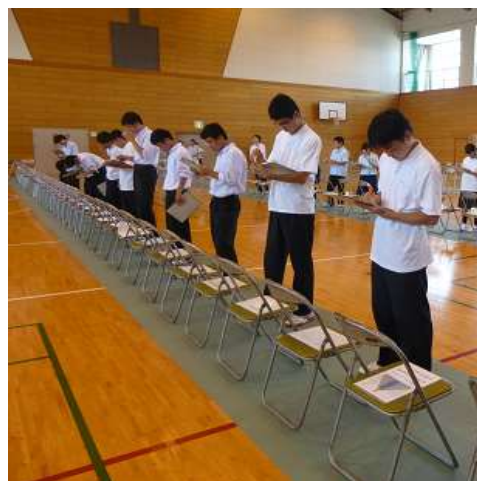
農業鑑定競技会県大会の様子