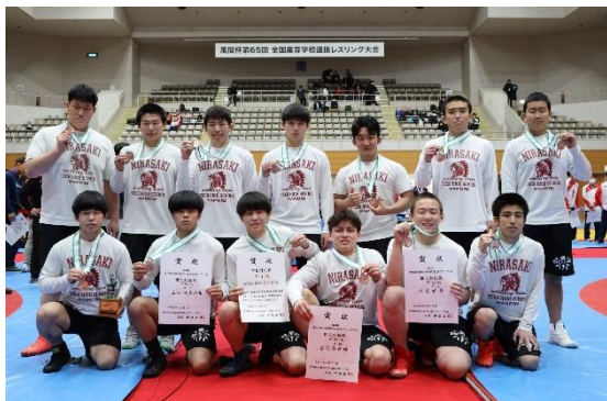
全国高校選抜大会で3位入賞 (レスリング部)