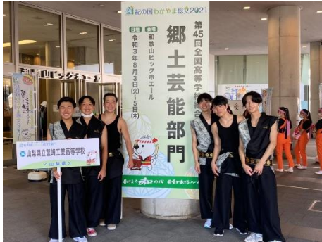
全国総文祭に出場した太鼓部員

部活動は、オリンピック金メダリストを輩出し、全国優勝者を出したレスリング部をはじめ、サッカー部、バレーボール部、野球部、ソフトテニス部、バスケットボール部、陸上部、卓球部、テニス部、ハンドボール部、弓道部、剣道部、山岳・スキー部、バドミントン部、茶道部、太鼓部、写真部、吹奏楽部、エコカー部、ロボット工学部、囲碁・将棋部、資格取得部、環境化学部、文化・生活部等多くの部が活躍しています。