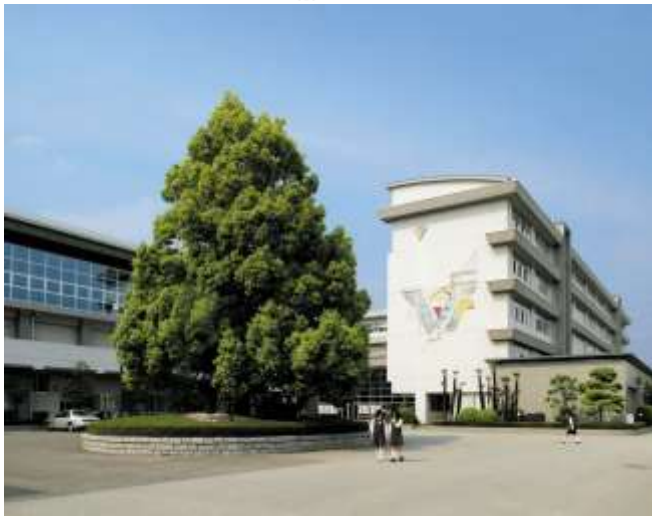
5階建ての校舎、2階建ての体育館など充実した学習環境

所在地 〒400-0854 甲府市中小河原町 222 番地 電話 055-241-3191 FAX 055-241-3145 URL https://www.kofuminami-h.ed.jp E-mail nanko@kofuminami-h.ed.jp 創立 昭和38年4月1日 課程 全日制 利用交通機関 JR身延線 甲斐住吉駅より徒歩12分 山梨交通バス 甲府南高校前(学校入口) 教員数 50名 生徒数 700名