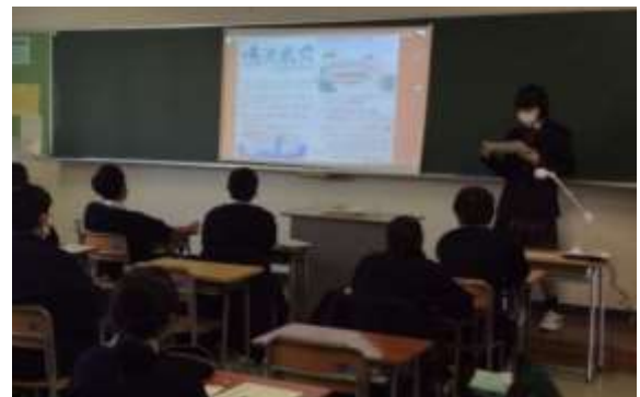
総合的な探究の時間（J-SPACE）の様子

生徒一人ひとりの個性を伸ばすことを基本に、将来の職業選択を視野に入れた科目選択の指導を行います。「産業社会と人間」「総合的な探究の時間」などの授業を通じてあなたの輝く未来が見えてくるはずです。