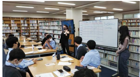
都留文科大学留学生と交流している様子