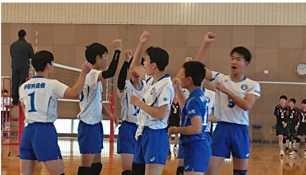
男子バレーボール部の活躍

《体育局》ソフトテニス、剣道、卓球、サッカー、レスリング、相撲、弓道、バスケットボール、バレーボール、陸上、野球、ラグビー、ウエイトリフティング《文化局》美術、書道、箏曲、演劇、英語、JRC、吹奏楽、放送、文芸、科学、合唱、写真、工学研究、囲碁・将棋