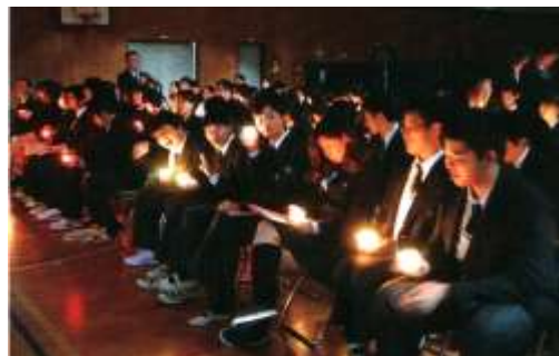
クリスマス会(燭火礼拝)の様子