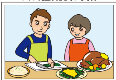
アラン先生が見せている写真