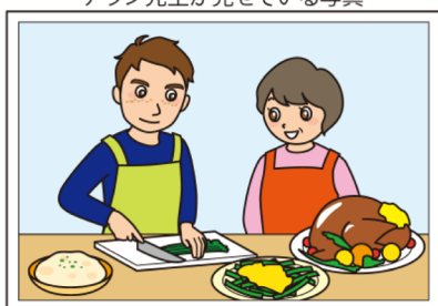
アラン先生が見せている写真