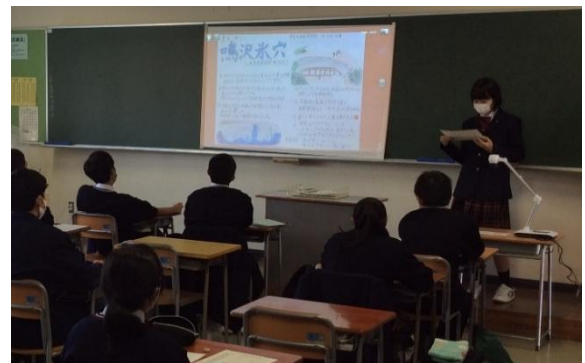
総合的な探究の時間（J-SPACE）の様子

生徒一人ひとりの個性を伸ばすことを基本に、将来の職業選択を視野に入れた科目選択の指導を行います。「産業社会と人間」「総合的な探究の時間」などの授業を通じてあなたの輝く未来が見えてくるはずです。